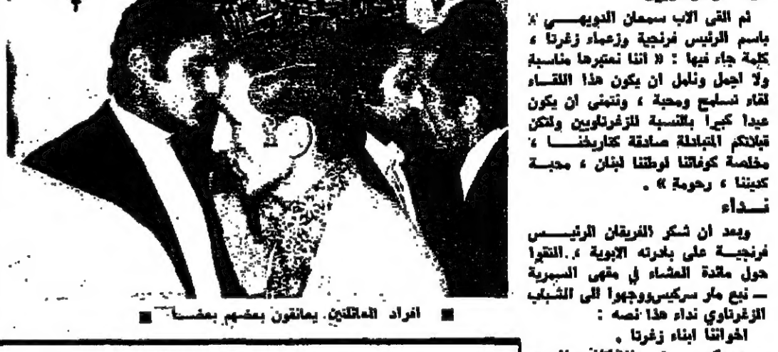
أفراد العائلة يتفقون بعضهم ببعض